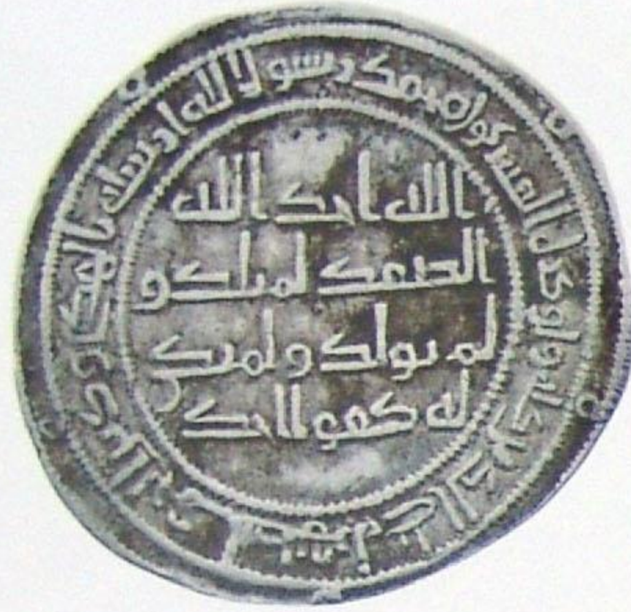
درهم أموي يزيد بن عبد الملك ضرب طبرستان سنة: ١٠٢ هجري